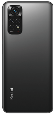
Redmi Note 11