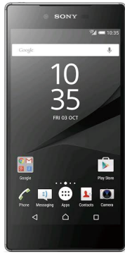
Sony Xperia Z5